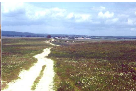
Alentejo, Pero Pião, zonas mais escuras com juncais do Trifolio resupinati-Holoschoenetum (M. Lousã)