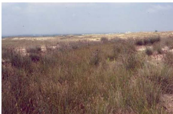
Algarve, Tavira, Pedras d'El Rei, juncais do Holoschoeno-Juncetum acuti (M. Lousã)