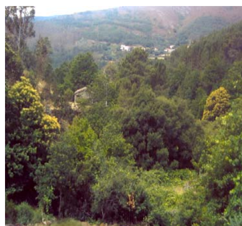
Beira Litoral, Castanheira de Pêra, Coentral Castanheiros em flor com carvalho alvarinho